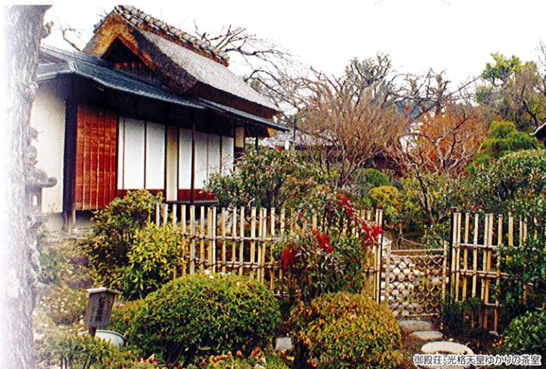
御殿荘:光格天皇ゆかりの茶室

西陣織/京鹿の子絞/京仏壇/京仏具/京漆器/京友禅 京小紋/京指物/京織/京くみひも/京焼・清水焼 京扇子/京うちわ/京石工芸品/京人形/京表具